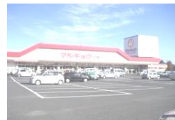
マルキョウ兵庫店(車で5分)